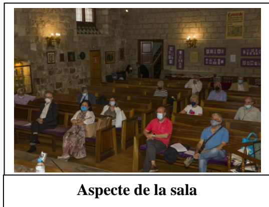
Aspecte de la sala

En principi, el dia de la junta, només es votà incloure les aportacions, l'import s'aprovaria en una pròxima junta general. Les aportacions proposades foren de 500 € i 200 € pels acadèmics numeraris i corresponents, respectivament, voluntàries pels emèrits, i estarien lliures d'aportacions els acadèmics estrangers. Es recorda que les aportacions són desgravables i es podran fer en dos terminis.